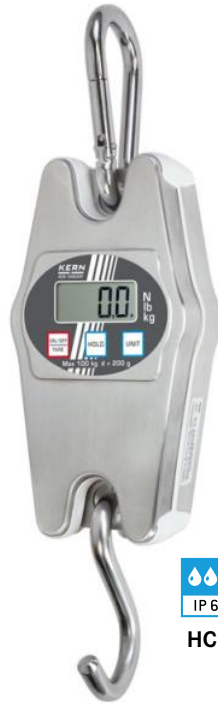
IP 65 HCN